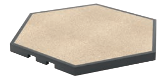
Podest niedrig (0,15m)