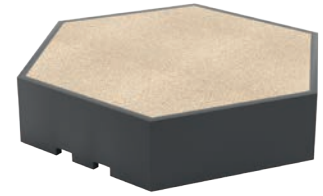
Podest hoch (0,55m)